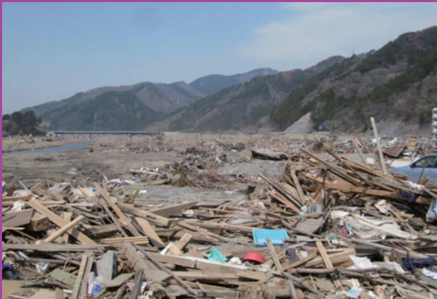
2011 東北地方太平洋沖地震